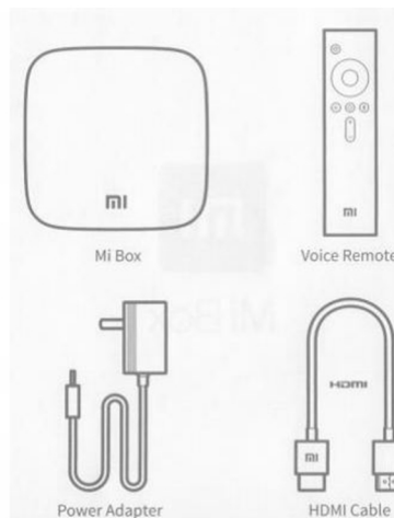
V balení naleznete 1) Mi Box, 2) Dálkové ovládání, 3) Napájecí adaptér, 4) HDMI kabel Baterie do dálkového ovladače nejsou součástí balení. Jedná se o 2x AAA, používejte kvalitní, alkalické.

- Dálkové ovládání je napájeno dvěma AAA bateriemi. Baterie nejsou součástí dodávky. - Používejte výhradně kvalitní, značkové alkalické baterie. V případě vytečení elektrolytu do ovladače a jeho následné nefunkčnosti Vám nebudeme moci uznat záruční opravu.