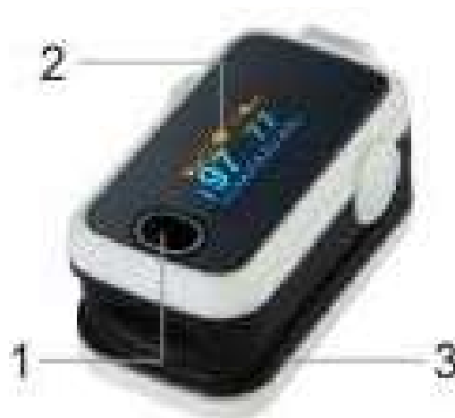
Obr. 3.1.1 Části předního a zadního panelu