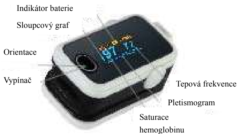
Obr. 3.2.1 Displej OLED

Po zapnutí vypadá displej OLED oxymetru následovně: